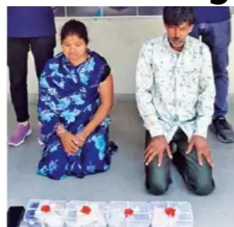
Ahmedabad, Vatwa dealer caught before Shahrulkh's man arrived. 525 grams of MD drug sent by MP dealer. 2 including

a woman caught before Vatwa dealer received it. The Crime Branch arrested two people, including a woman, who had come to Ahmedabad to deliver 525 grams of MD drugs from Madhya Pradesh for five thousand rupees. Both were running fruit rickshaws on the sidelines and were doing this work because they needed money. They had taken drugs from a dealer in Madhya Pradesh and had come to give them to a dealer in Vatwa. Police have seized drugs worth Rs. 52.50 lakh and have started efforts to catch the dealers who sent and ordered MD drugs.